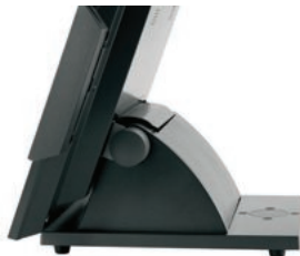
Cubierta posterior MTS10