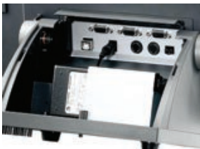
Fuente de poder oculta MTS10